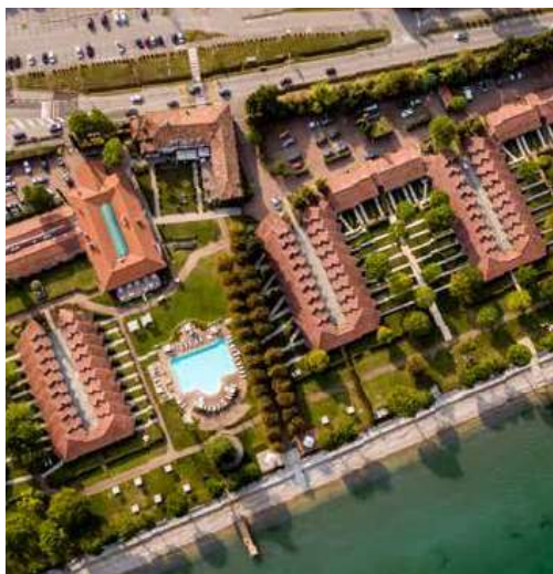
Splendido Bay Il resort di lusso affacciato sul Lago di Garda

Uno degli investimenti più significativi nel settore turistico è lo Splendido Bay di Desenzano del Garda, un'imponente struttura di 6 ettari completamente affacciata sul lago, dotata di tutte i comfort per 76 suite di lusso a 5 stelle. Inoltre, l'Hotel Majestic di Brescia è un'evidenza del successo targato Mael Spa nel settore alberghiero. Il gruppo ha espanso la sua presenza nel commercio e nella logistica attraverso la gestione di centri commerciali, strutture residenziali e una grande cava (Cave Ghigliazza Spa) in Liguria. Questa diversificazione ha contribuito a creare un portafoglio robusto di oltre 1.060 immobili, che comprende anche rinomati ristoranti e centri turistici, cui si aggiunge una ri-