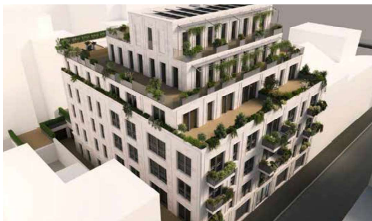
Via Donizetti 20 Un palazzo storico sito in Milano, oggetto di risanamento per opera di Mael Spa

Con oltre 150 concordati fallimentari risolti con successo, la Mael Spa ha dimostrato la sua